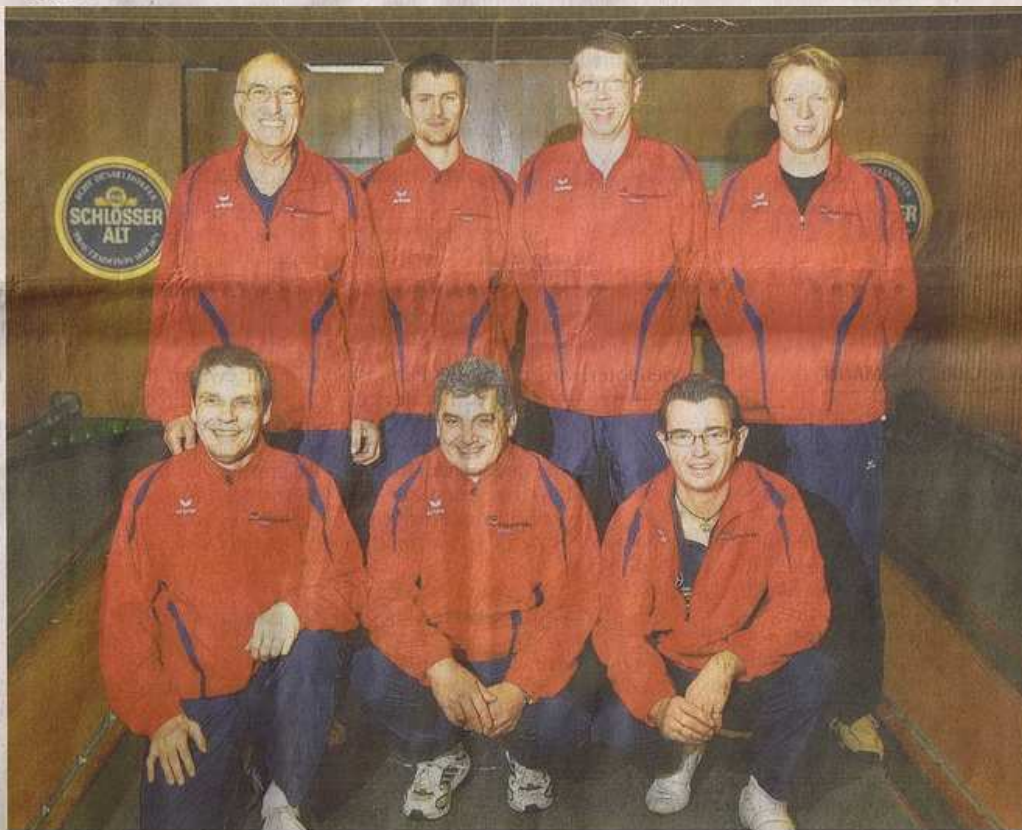
Die Mannschaft des SK Meide Hilden.